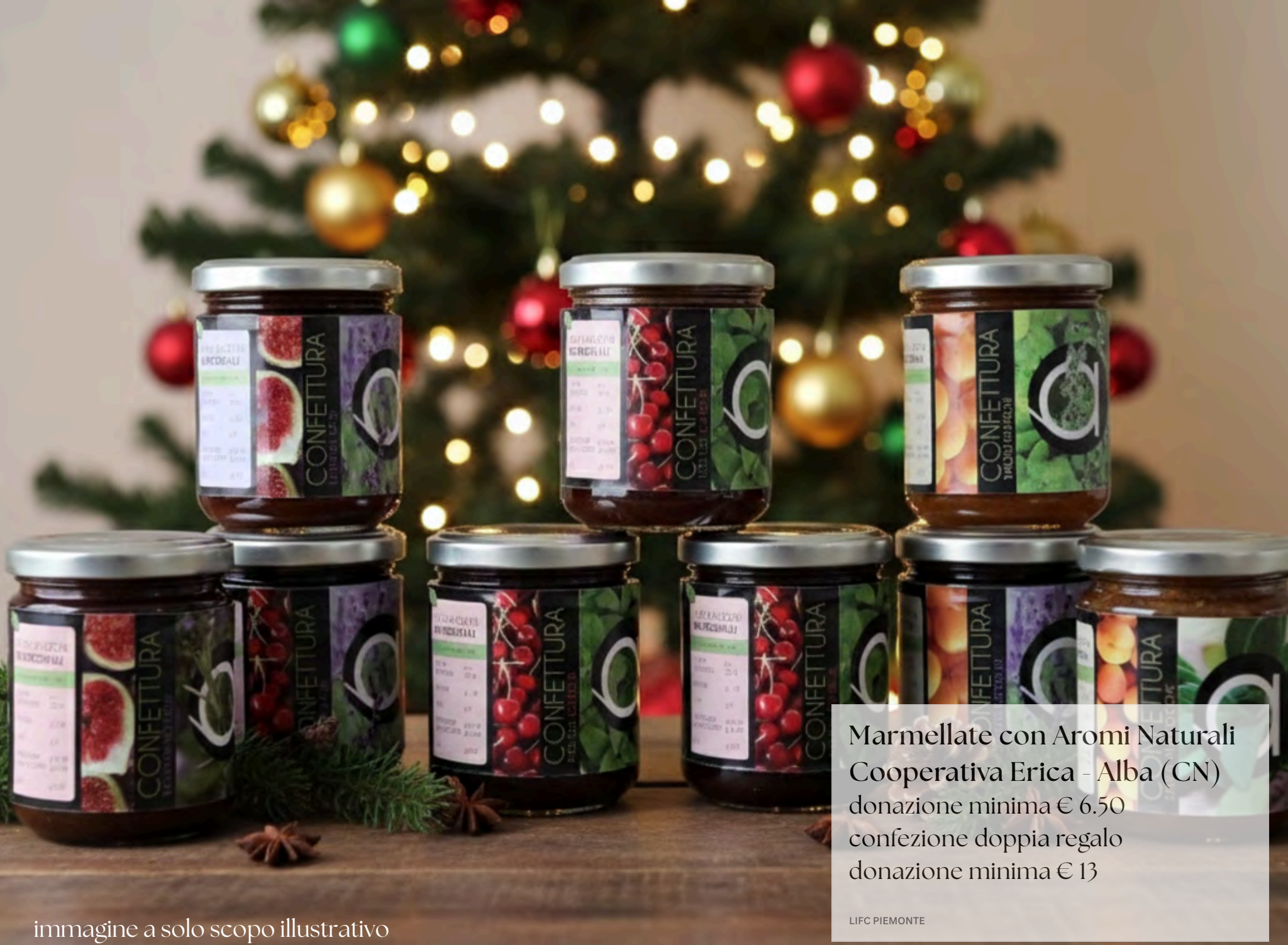
immagine a solo scopo illustrativo

Marmellate con Aromi Naturali Cooperativa Erica - Alba (CN) donazione minima € 6.50 confezione doppia regalo donazione minima € 13