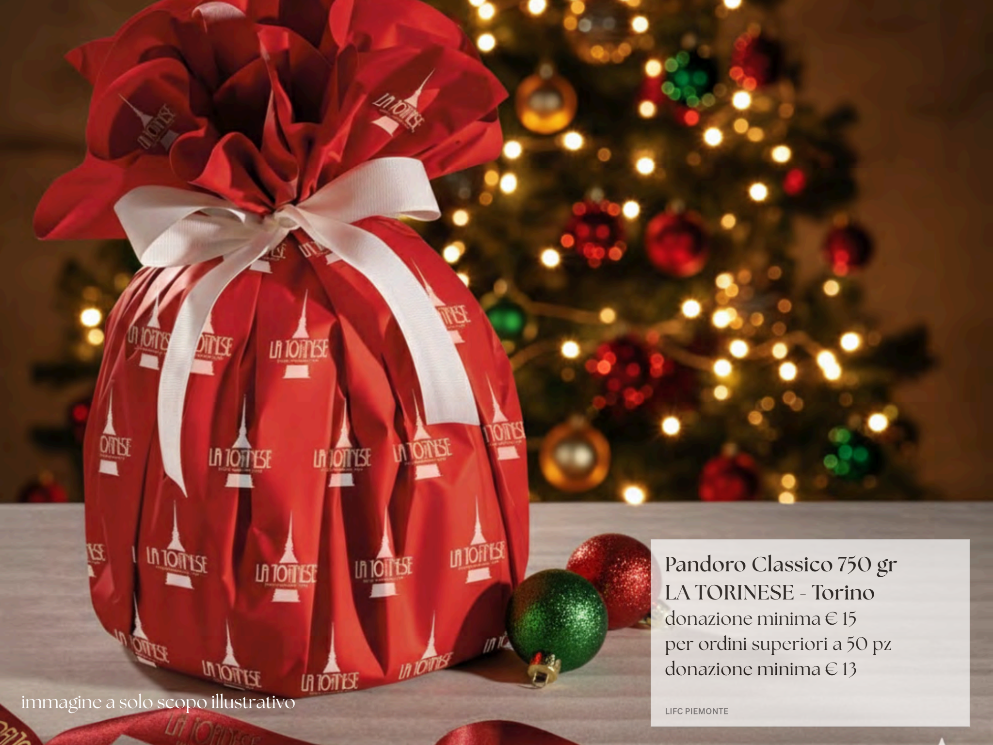
immagine a solo scopo illustrativo

Pandoro Classico 750 gr LA TORINESE - Torino donazione minima € 15 per ordini superiori a 50 pz donazione minima € 13